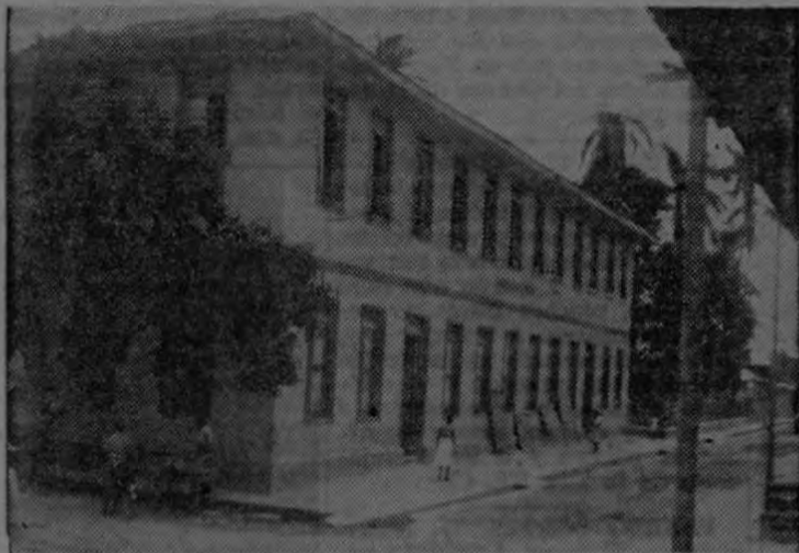
Esta es la hoy centenaria escuela Ascención Esquivel de la ciudad de Liberia, a cuyas fiestas conmemorativas fué invitado en forma muy especial EL PACIFICO.

Liberia, la Ciudad Blanca, vistiendo sus mejores galas, celebró dignamente el Cincuentenario de la Escuela Ascención Esquivel. Cincuenta años dedicados a la preparación y al mejoramiento espiritual de sus hijos.