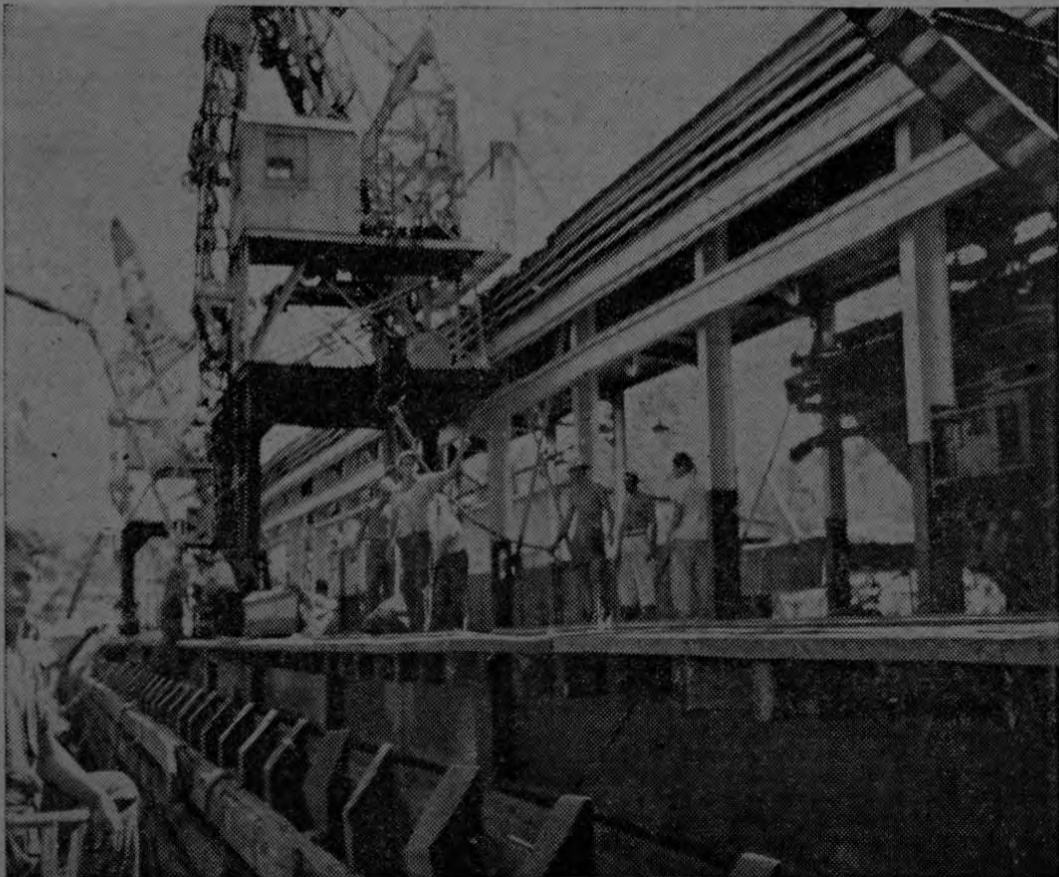
Esta espléndida vista fué captada por el lente de nuestro Director Edwin Salas y recoge una vista parcial del gran muelle del puerto de Quepos