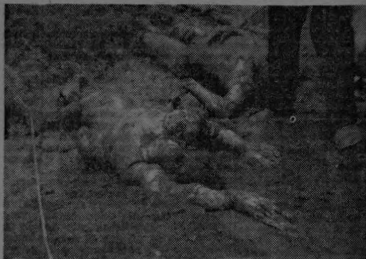
Varios muertos hallados en Tiquisate. Habían sido tatuados por los comunistas.

sin darnos agua o comida por espacio de dos días. En tres distintas ocasiones se nos hizo formar, en grupos, en el patio de la prisión, diciéndonos que se nos iba a fusilar, pero después había contraorden y nuestra angustia era prolongada así indefinidamente.”