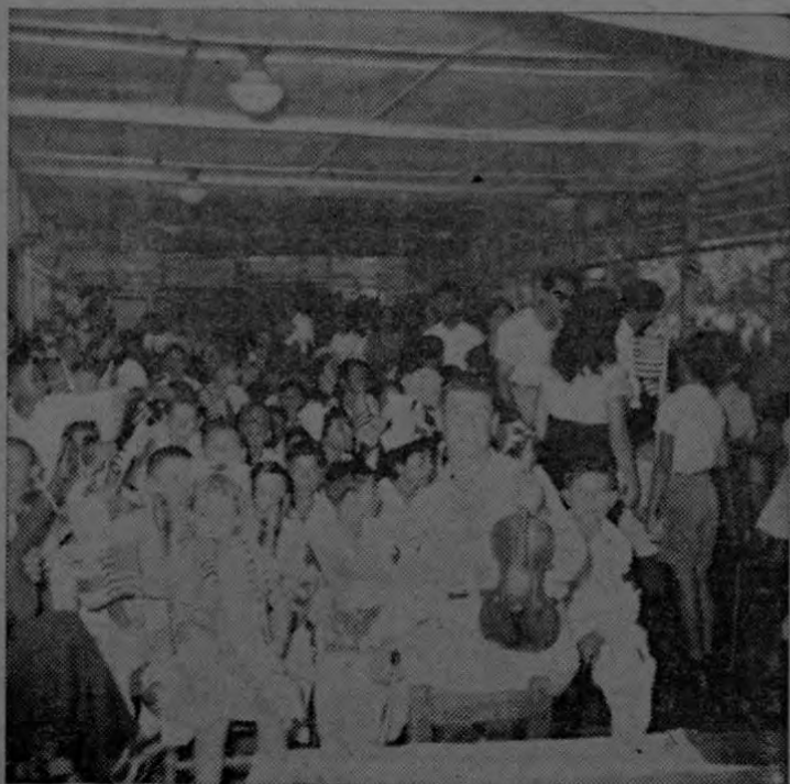
La escuela Central de Quepos celebró una hermosa velada con motivo del 4 de Julio, día de la independencia de los Estados Unidos de Norte América. Puede verse parte de la concurrencia. (Foto Murillo).