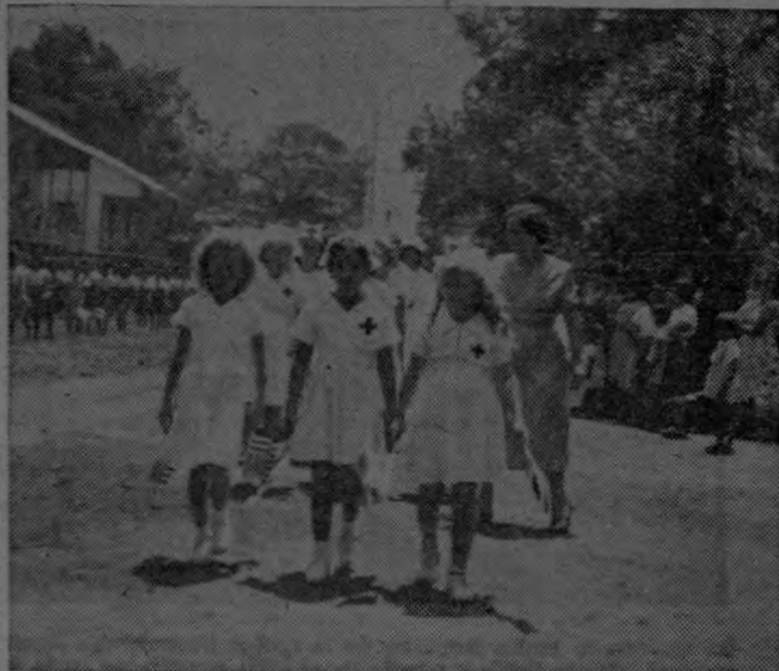
La gráfica de Murillo recoge la cabeza del desfile escolar que con motivo de los festejos del 4 de Julio tuvo lugar en Quepos, estando a cargo de la escuela central de Boca Vieja.