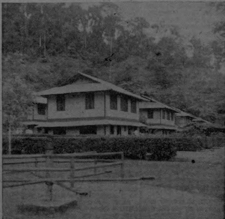
Estas magníficas construcciones para los trabajadores de la Compañía Bananera de Costa Rica en Kilómetro 1 en el puerto de Golfito, dicen del empeño en mejorar día con día las condiciones de los trabajadores de nuestra zona sur.