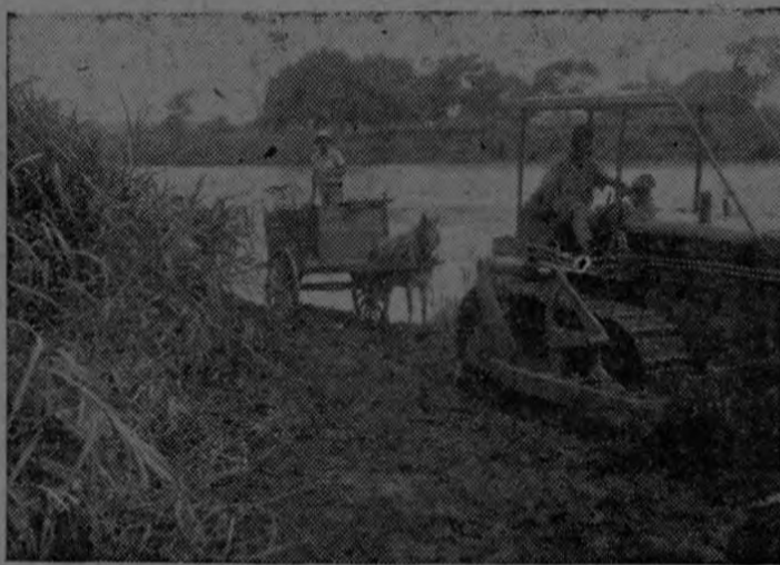
Un tractor de la Compañía Bananera de Costa Rica trabaja ampliando el camino para expedir el acarreo de basuras en Parrita, servicio a cargo de la Municipalidad del cantón de Aguirre.